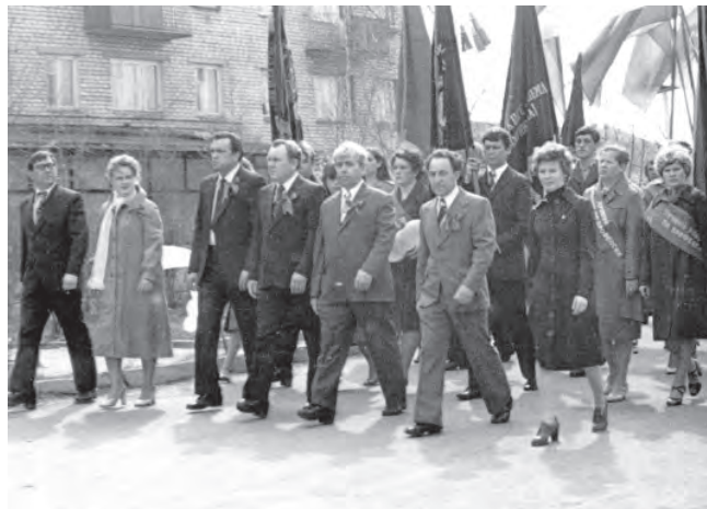
1 мая 1982 г.

танием на "фабрике-кухне", которая находилась в здании ГПТУ. В этом же здании было общежитие, а другое общежитие и учебные классы были в соседнем. Третье здание находилось на улице Луначарского ("Хитрый дом"). Общежитие №2 было на улице Октябрьской. После строительства пятиэтажного общежития, на втором был надстроен третий этаж, и его преобразовали в жилой дом, а "Хитрый" из-за ветхости был разобран. Теперь же с новым когда-то общежитием для молодежи и молодых семей непонятно что делать и какова участь его и обитателей? Кроме рабочей смены комбинат готовил специалистов среднего звена не только для себя, но и